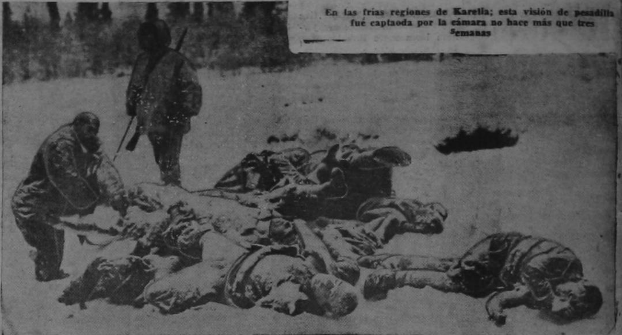
En las frías regiones de Karelia; esta visión de pesadilla fué captada por la cámara no hace más que tres semanas

LONDRES, 1º — El vapor noruego BROTT, de 1.583 toneladas, fué atacado por aviones alemanes, pero logró refugiarse en un puerto británico, habiendo sido heridos algunos de sus tripulantes.